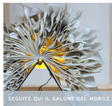
SEGUITE QUI IL SALONE DEL MOBILE